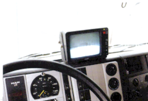
Monitor für Kameras

Alle Gewichtsangaben sind ca. * Mit Abrollkipper