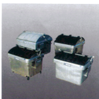
Müllgroßbehälter 2,5 bis 6,5 m 3