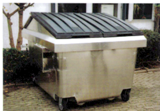
FRONTLADERBEHÄLTER FLB 4,5