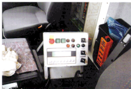
Bedienpult mit 1,1 Pocketsteuerung

Der Frontkipper EcoPack wird in eigenen Werkstätten gefertigt. Jede Hydraulik-Werkstatt kann die Service- und Reparaturarbeiten übernehmen.