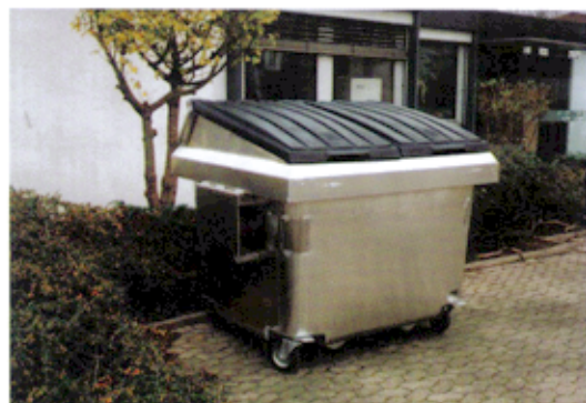
FRONTLADERBEHÄLTER FLB 2,5 A

Für jede Aufgabe die optimalen Frontladerbehälter