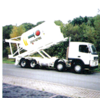
COMBILIFT Typ 19,45 - 35,71