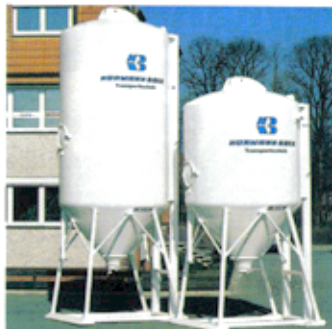
Wechselsilos 10 - 25 m 3