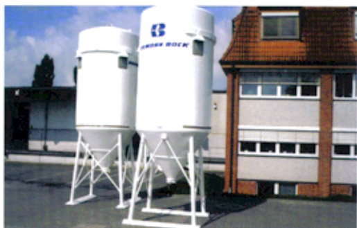
ZWEITASCHENSILOS WST 22