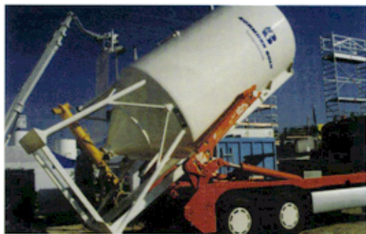
COMBILIFT Typ 26,71 mit WS