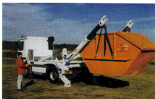
DELTA PRO 14 Absetzkipper